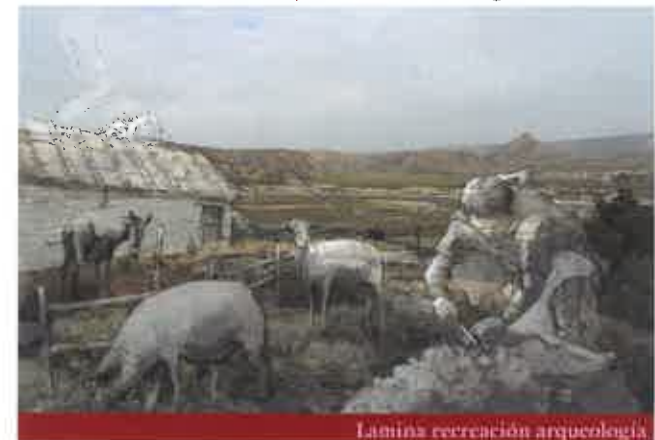
Lamina recreación arqueología

RASO DE JAVIELO - (Iñaki Dieguez Uribeondo)