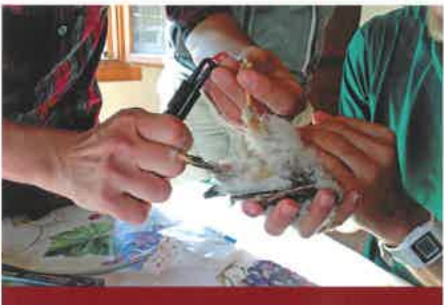
PROYECTO RECUPERACIÓN CERNÍCALO PRIMILLA