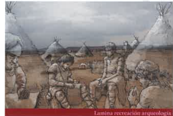
Lamina recreación arqueología

LLANOS DE ESCUDERO - (Iñaki Dieguez Uribeondo)